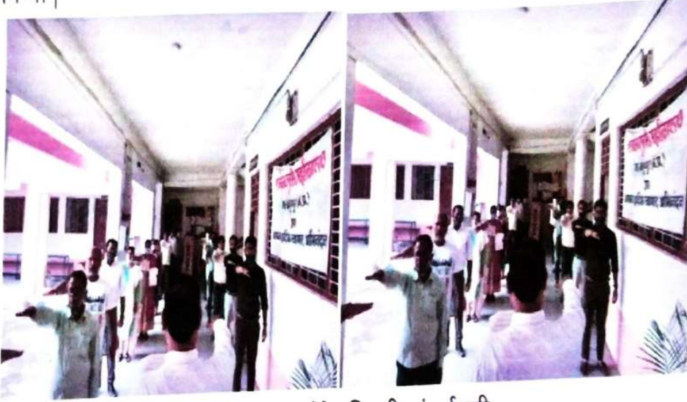
मतदाता जागरूकता शपथ लेते अधिकारी एवं कर्मचारी